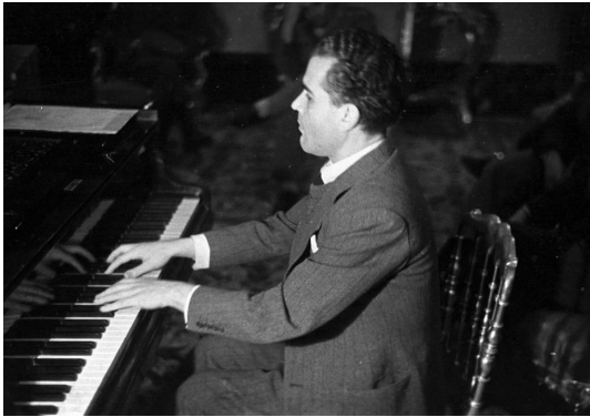
Rafael Rodríguez Albert